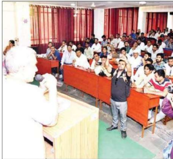
रोजगार मेले में पहुंचे बेरोजगार।

रोजगार मेले में गर्मी होने पर भी नौकरी पाने वाले युवाओं की भीड़ उमड़ी रही। साक्षात्कार की प्रक्रिया शाम तक चलती रही। 1000 से अधिक छात्रों ने रोजगार मेले में पंजीकरण कराकर भाग लिया। रोजगार मेले में 50 से